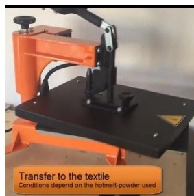
Presser à chaud