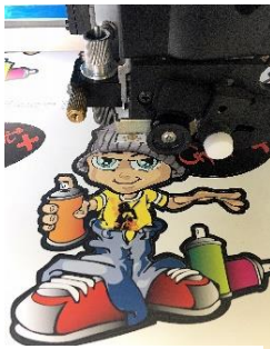
Imprimer et Découper

Il est conseillé de laisser sécher les encres avant d'appliquer le film transfert, sans quoi l'impression pourrait se dégrader plus rapidement au lavage.