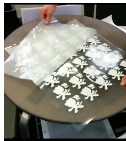
Enlever le liner