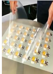
Appliquer le film de transfert