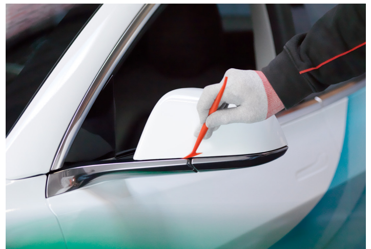
Excellente conformabilité 3D pour les projets de covering complexes de véhicules et de flottes.

Pour obtenir plus d'informations, veuillez contacter votre représentant de vente ou visiter le site web Avery Dennison à l'adresse : graphics.averydennison.fr/sp1504