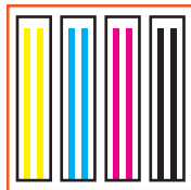
1 ère tête : CMJN

La première tête imprime le CMJN, la seconde le Blanc et le Vernis : impression multi-couches sans perte de vitesse. Une configuration parfaite pour les applications telles que le braille et les impressions de structures 2.5D.